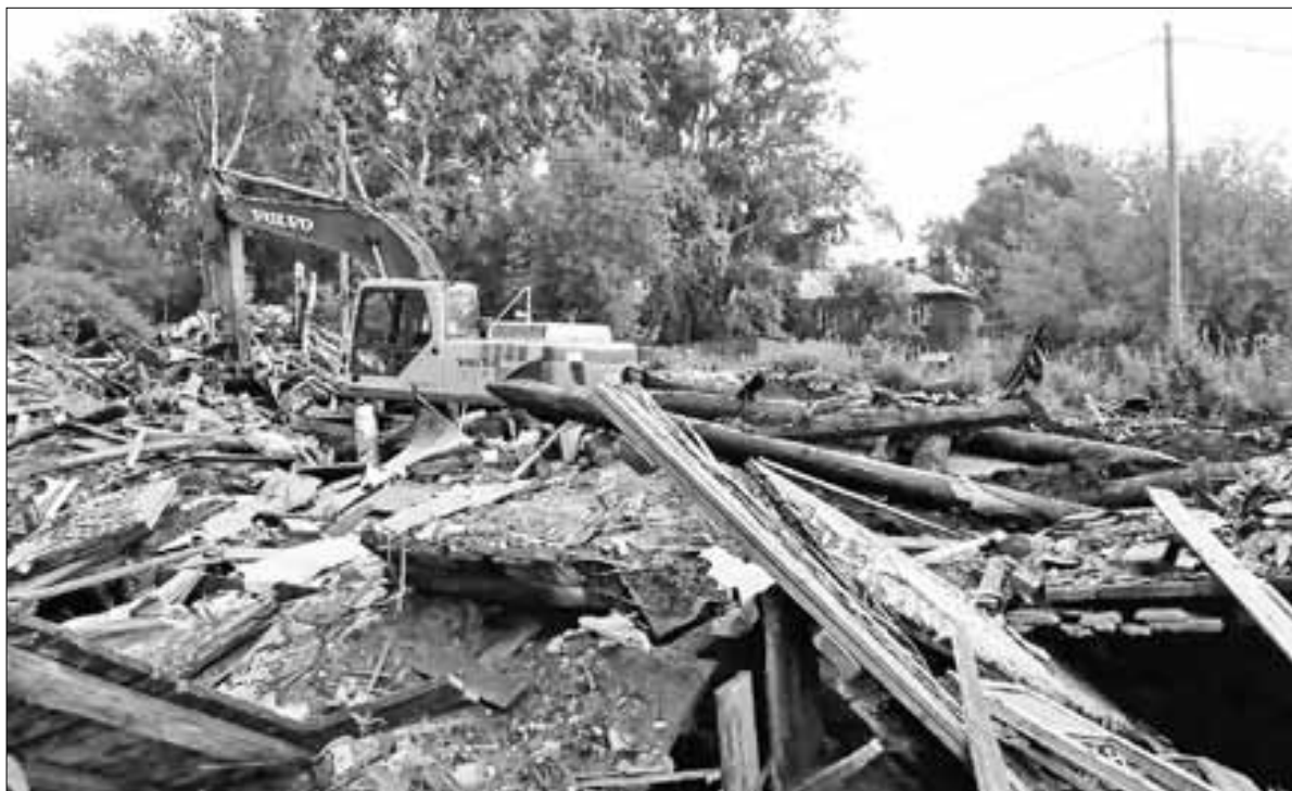
■ К началу сентября администрация города планирует расчистить территории по 70-ти адресам.