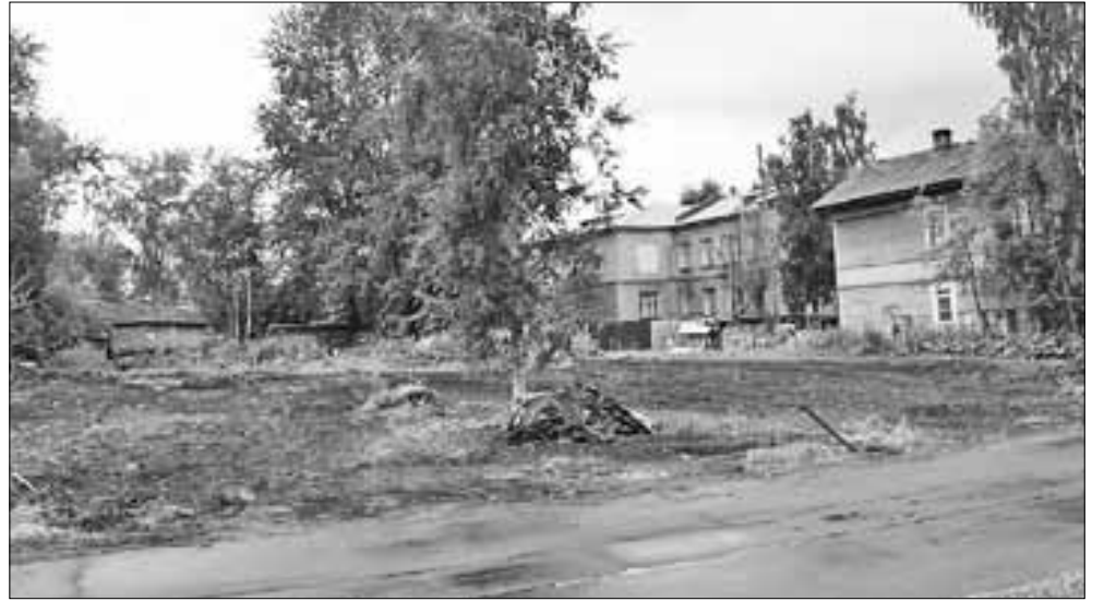
■ На месте аварийного дома на ул. Челюскинцев теперь расчищенный ровный участок.

В рамках губернаторской программы «Архангельск: новая история» в столице Поморья продолжают расчищать руины расселенных «деревяшек» и облагораживать фасады многоквартирных домов.