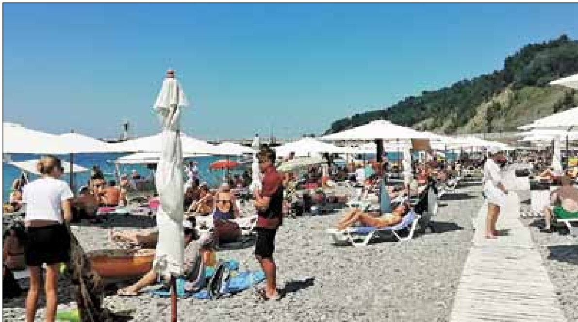
■ Центральный городской пляж: яблоку негде упасть

пытаются нагнать упущенное время и выгоду