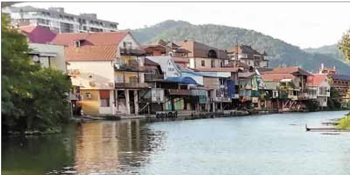
■ «Дагомысская Венеция» – так называют эти кварталы на воде

Хозяйка отеля, который мы бронировали заранее, тоже отметила, что отдыхающие стали приезжать уже после середины июля. Большой наплыв ждут в августе, начале сентября – пошел спрос на