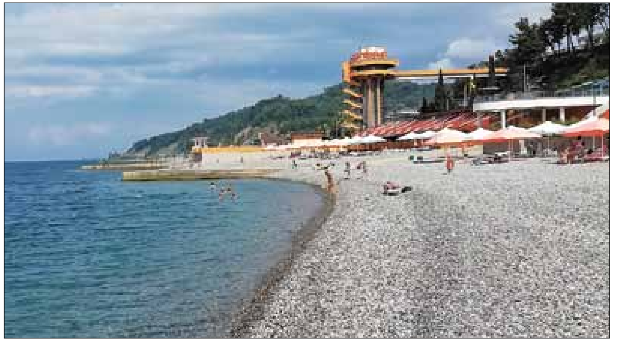
■ На пляже оздоровительного комплекса «Дагомыс» чувствуешь себя комфортно

Оказалось, что путешествовать на отдых с рюкзаком очень даже удобно. Никаких ожиданий выдачи багажа в аэропорту, все необходимое с собой. Шорты с майкой, туника, платье на вечерний выход, сланцы, «рыбно-мыльные» принадлежности перелиты в специальные самолетные флакончики менее ста миллилитров – в рюкзак все это богатство уместилось отлично, даже для книги место осталось.