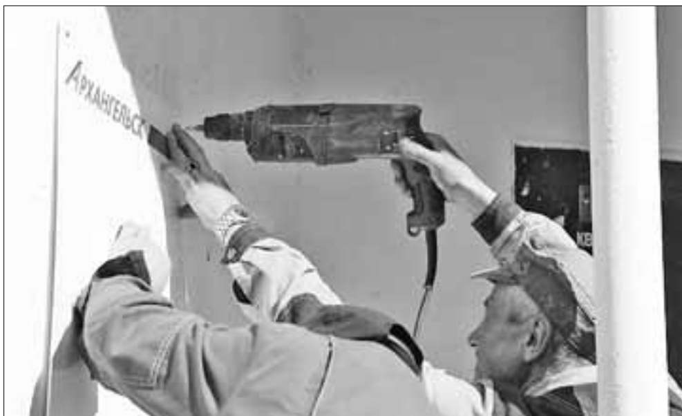
■ Чистые, яркие подъезды этим летом начнут радовать глаз жителей более чем 300 многоквартирных домов во всех округах города.

В рамках губернаторской программы «Архангельск: новая история» в столице Поморья ремонтируют дороги и тротуары, сносят руины расселенных домов, обновляют внешний вид подъездов, ремонтируют дворы, парки и скверы, а также украшают улицы города яркими арт-объектами.