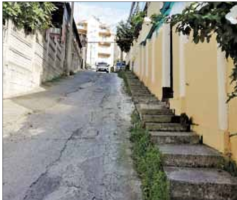
■ Узкие улочки с подъемами и спусками характерны для городка

бронь. Цены они не поднимали: как они были в прошлое лето, так и остались. Хотя, по сути, месяц, а то и полтора, потеряли, но задержать стоимость тоже опасаются, все-таки нужно держать баланс между спросом и предложением.