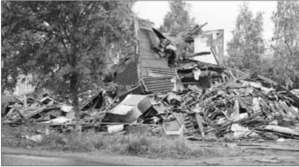
■ Старую «деревяшку» на ул. Георгия Иванова снесли, следующий этап – приведение в порядок территории.

Архангельск меняется на глазах – горожане отмечают перемены к лучшему