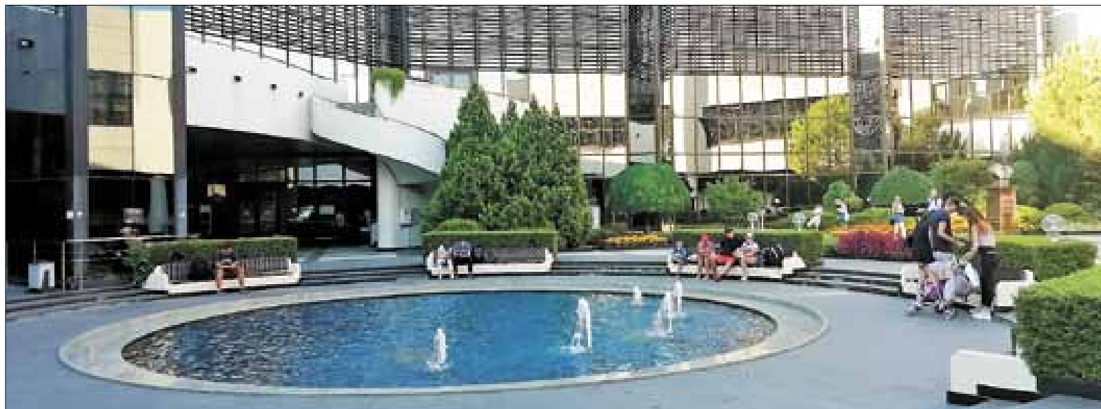
■ «Оазис» в зоне вылета сочинского аэропорта

Как итог: я не большой любитель ездить в одно и то же место по несколько раз, но в Дагомыс скорее всего вернусь – в первую очередь из-за этого бесподобного пляжа и чистого моря. А еще с удовольствием повторила бы нежнейшие сырники с малиновым джемом на завтрак в кафе «Ласточка», форель горячего копчения только что с дыма в ларьке напротив или барабульку, купленную у дедушки в частном доме, изумительного вкуса черноморские рапаны в ресторане «Нептун», шум ночного прибоя и лунную дорожку на море – именно за эти контрасты мы и любим наш юг.