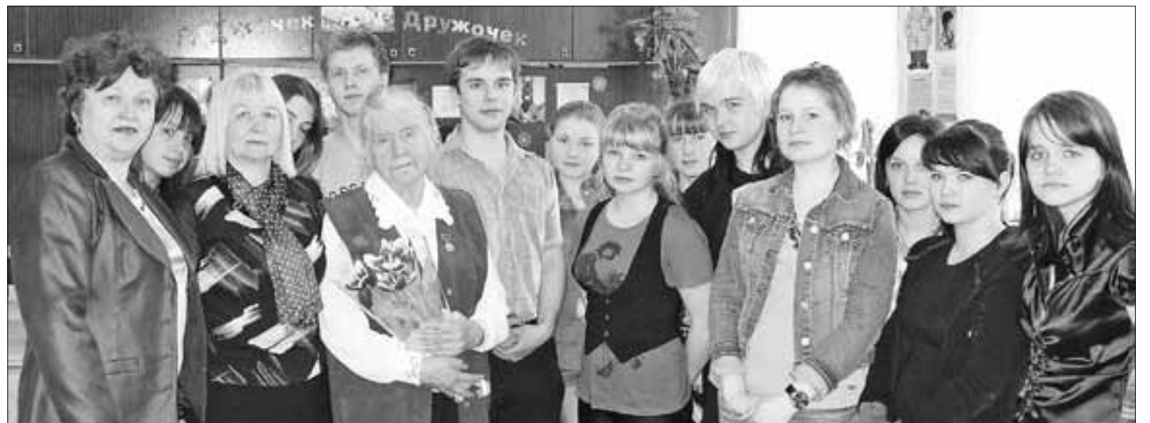
Учащиеся и коллеги всегда очень любили ее, в их сердцах она останется как добрый друг и наставник.

Материал подготовлен Архангельским педагогическим колледжем и городским Советом ветеранов