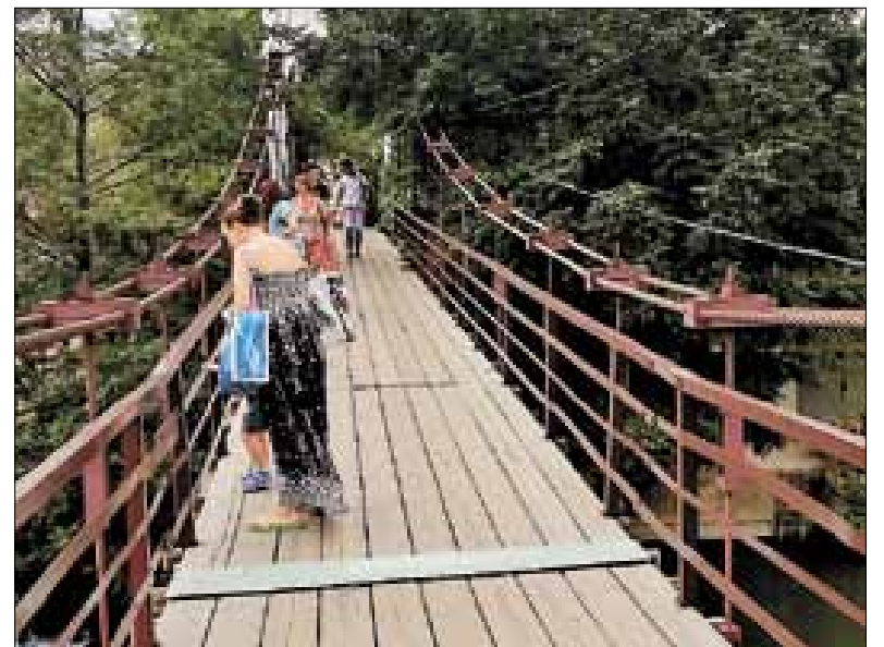
■ Подвесной мост через реку делит Дагомыс на две части